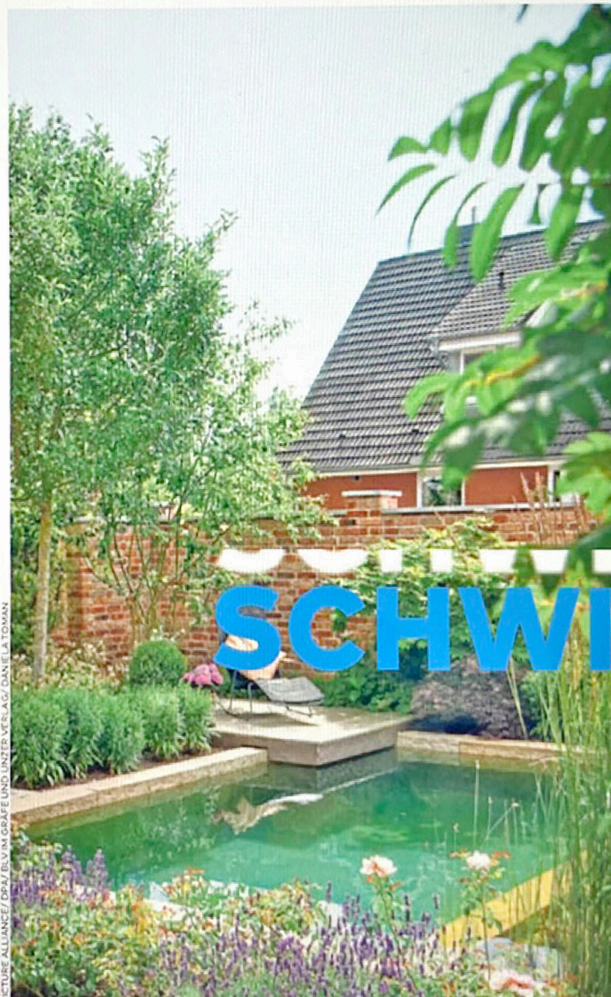
Grüne Oase im Garten: Naturpools werden in Deutschland immer beliebter

Ein durchschnittlicher Aufstellpool mit 3,66 Meter Durchmesser fasst laut Berechnung des Bundesverbands der Energie- und Wasserwirtschaft (BDEW) ein Volumen von 6500 Liter Wasser. „Dies entspricht dem 52-fachen des Tagesbedarfs einer Person“, sagt Martin Weyand vom BDEW. Und